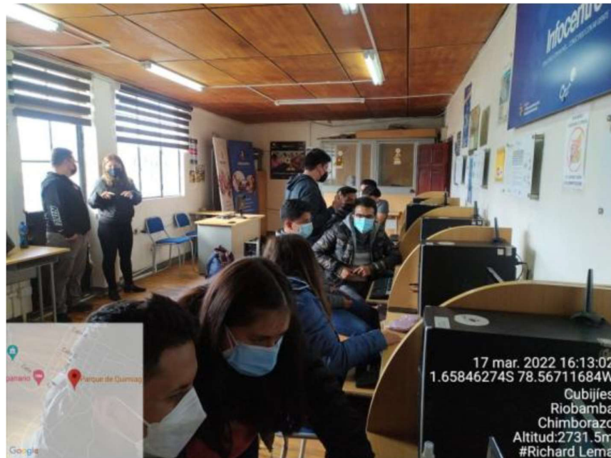
Figura 1. Interior Infocentro Quimiag

Imágenes del proyecto (2 imágenes que pesen aprox. 500kb)